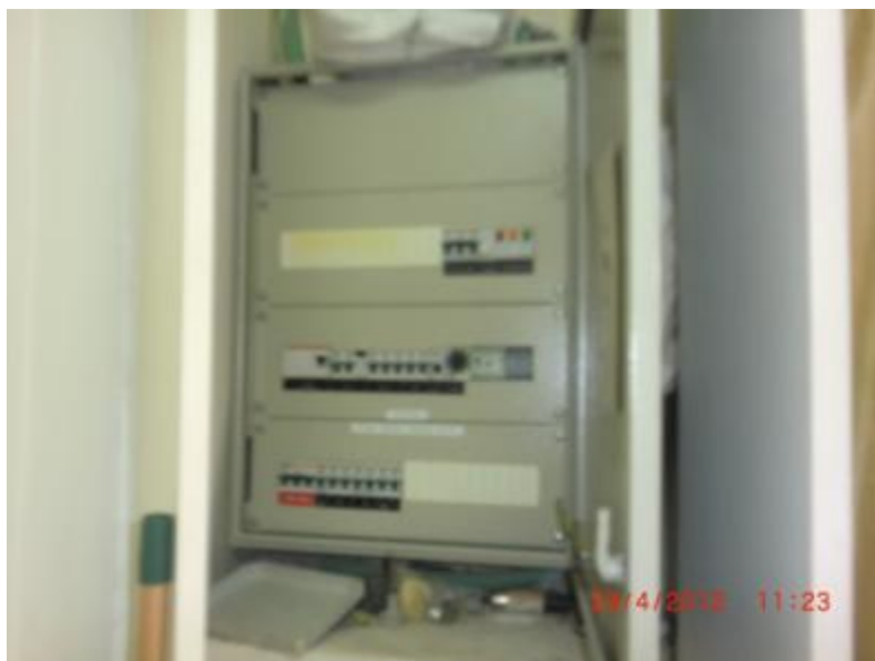
תמונה 2: פינת ארון החשמל במבואת הגן